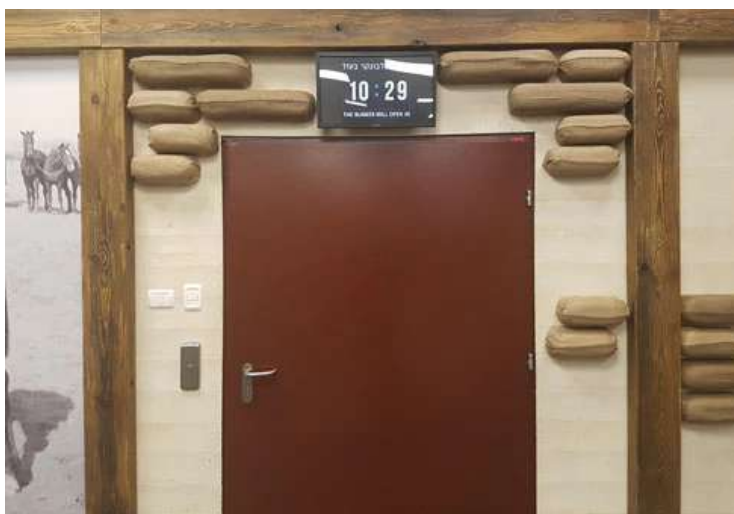
בתערוכת הקבע