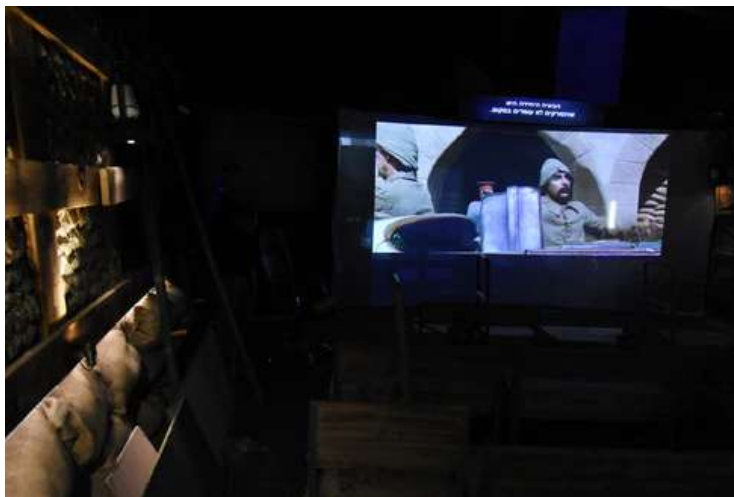
מתוך המיצג האור-קולי