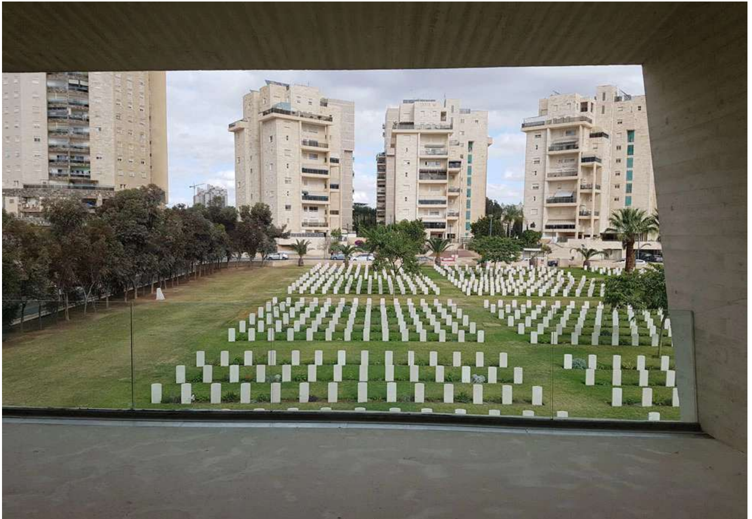
ללא הכנה מוקדמת, יוצאים המבקרים מאפלולית התצוגה המלחמתית אל מרפסת שחושפת בפניהם את אור השמש הדרומית ואת המחזה הבא