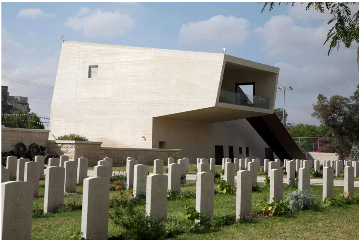
מרכז ההנצחה לחללי אנז"ק בבית העלמין הבריטי בבאר שבע. תכנון: מייזליץ-כסיף אדריכלים