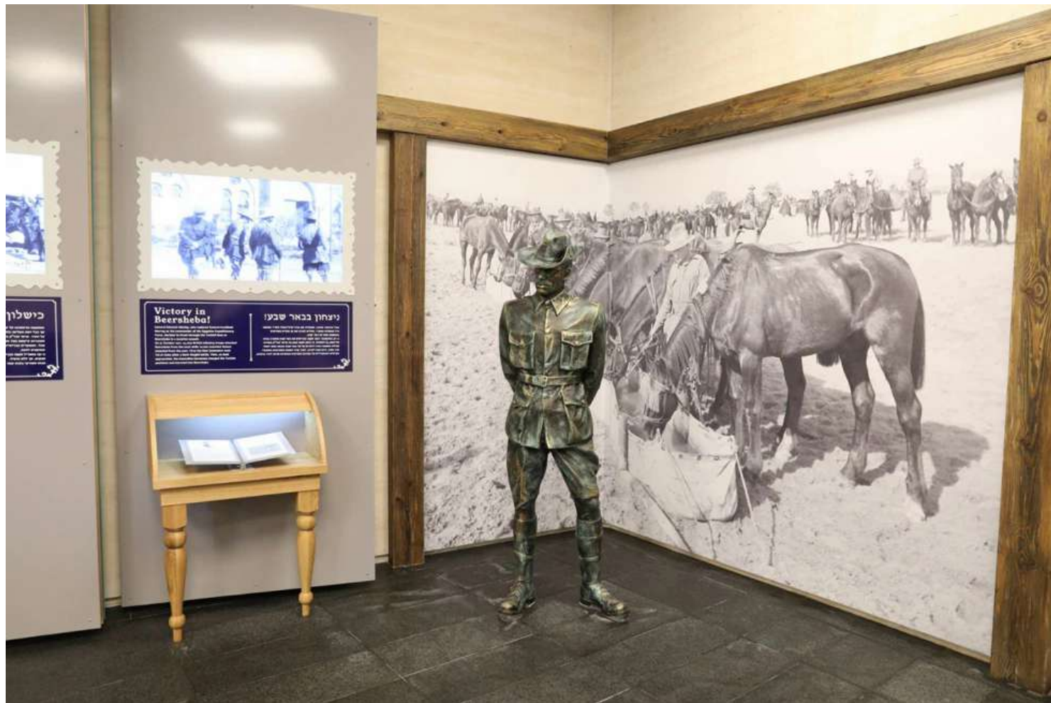
בין המוצגים בתערוכת הקבע: פסלי חיילים, מצלמה כמו-ישנה ופריטים שמספרים את תולדות הקרב המפורסם