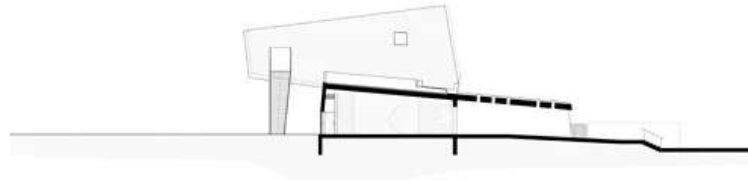
(חתך: מייזליץ כסיף אדריכלים)