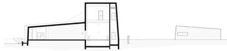
(חתך: מייזליץ כסיף אדריכלים)