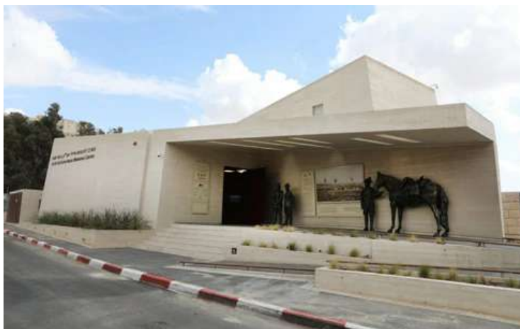
כאן היה בוטקה של גנני בית הקברות. עכשיו זהו מוזיאון

החריגה היחידה היא אותו "בונקר-מעלית", שאמור לדמות שוחת מלחמה בעזרת שקי חול מסביב לכניסה וארגזי עץ שמקיפים את המבקרים בתוך המעלית עצמה. מתוך הארגזים מאירות מנורות, בכל פעם שנשמעת ירייה במהלך הצפייה בסרט האוסטרלי "The Lighthorsemen" (1987, כאן מציגים גרסה מקוצרת), שמגולל את סיפור הקרב. העין הישראלית תבחין כי הוא לא צולם בנגב, אלא בערבות אוסטרליה.