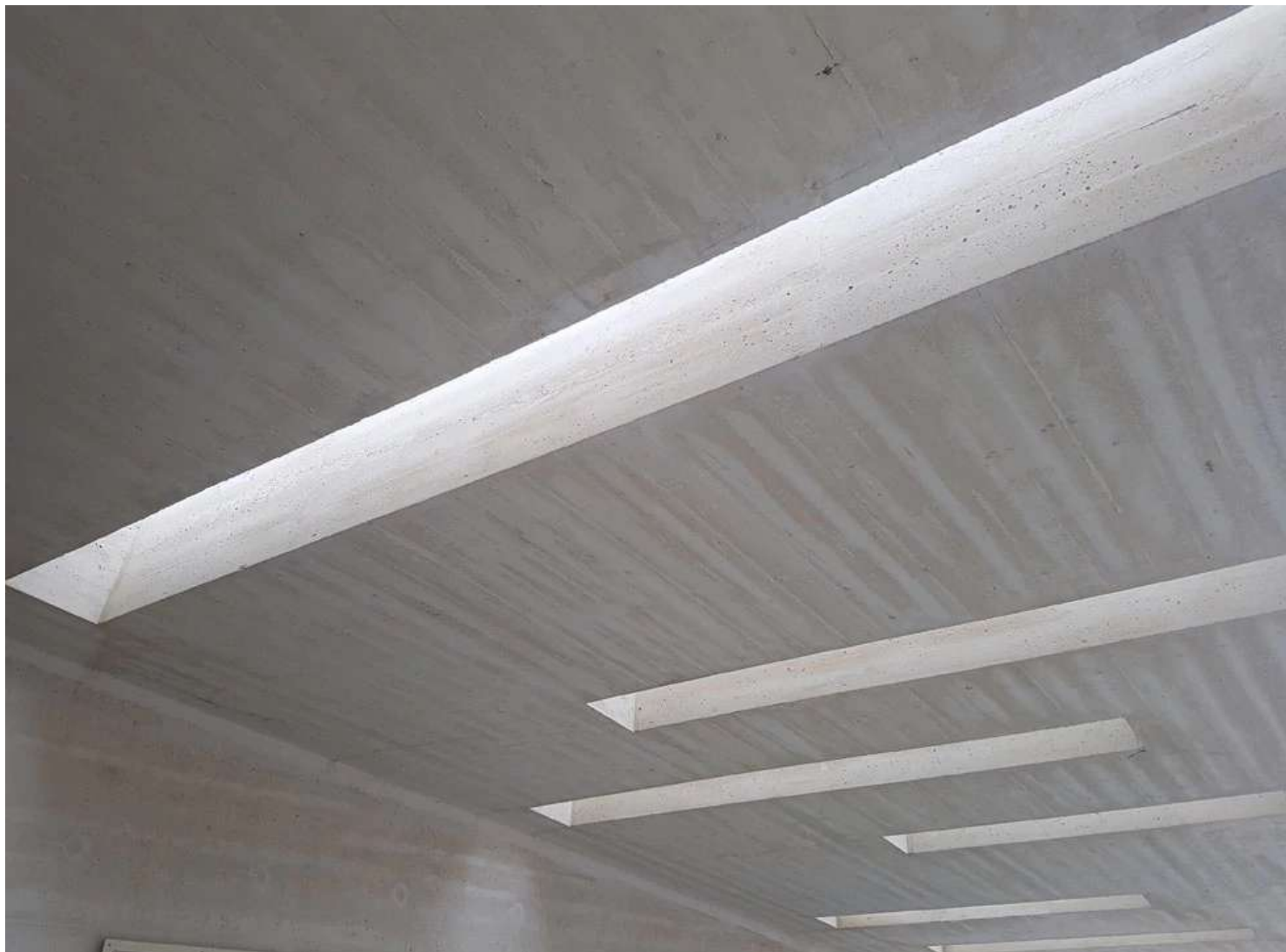
הבטון החשוף חוזר אל טכניקת הבנייה הברוטליסטית, שאפשר לפגוש מעבר לכביש בהוסטל "אלטשול" של האדריכלים יסקי ואלכסנדרוני: סידור מוקפד של קרשי היציקה, עם עדכון עכשווי שמונע תקלות של בריחת בטון

תגיות: מלחמת העולם הראשונה, באר שבע, הנצחה, אדריכלות בבאר שבע