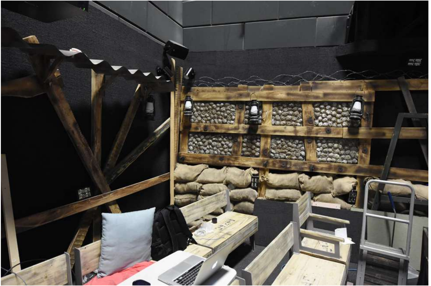
הבונקר-מעלית, שהוא חלק מרכזי בחוויית הביקור, עטוף מבחוץ בשקי חול ובפנים בארגזי עץ שמדמים שוחה