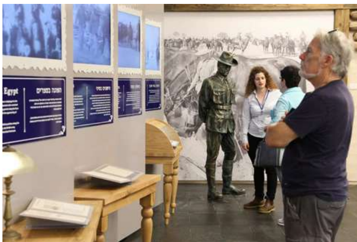
להצטלם עם פסל של חייל