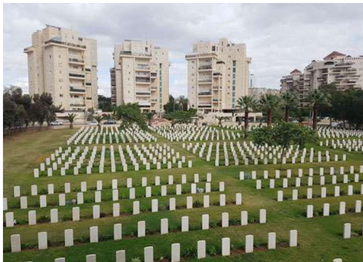
הנוף שנשקף לפתע לעיני המבקרים: הקברים הסימטריים ומעליהם מבני מגורים

הקונטציה ל"יד ושם" בהקשר הזה מתבקשת. בסיום הביקור במרכז ההנצחה בבאר שבע, בדומה למוסד הנצחת השואה בירושלים, מוצא עצמו המבקר ניצב על מרפסת מול הנוף הפתוח. את נוף הרי ירושלים והמושבים אדומי-הגגות, שנועדו כמאמר האדריכל משה ספדיה לייצג את המעבר משואה לתקומה, מחליף בבירת הנגב נוף סיפורי לא פחות: שורות הקברים הסימטריות של חיילי צבאות אוסטרליה, ניו זילנד ובריטניה, כשמעליהם מתנשאים בנייני מגורים גנריים משנות ה-90 עם מרפסות זיג-זג.