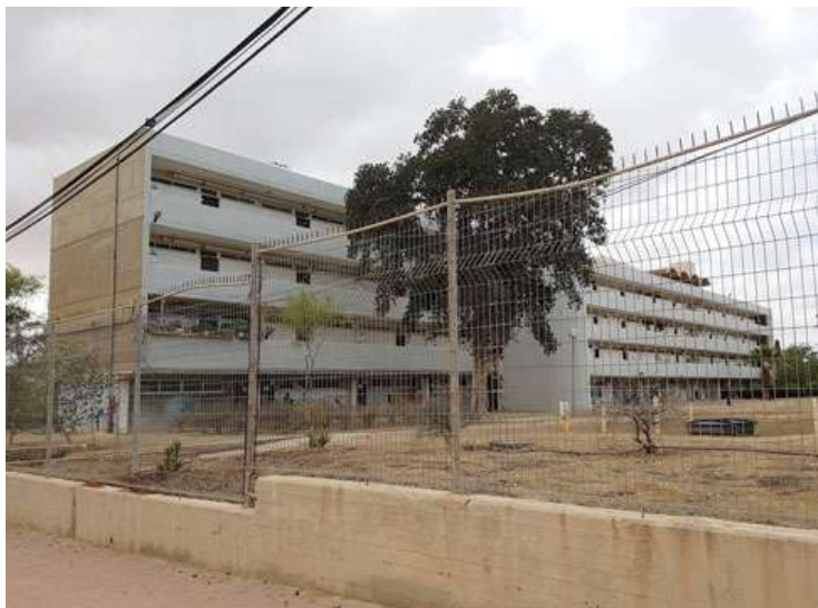
מרכז הקליטה "אלטשול" (יסקי ואלכסנדרוני, 1957) מעבר לכביש. למרות פגעי הזמן והאדם, יציקת הקיר הצדדי נראית כאילו רק השתבחה עם הזמן

הבטון החשוף אצל מייזליץ-כסיף חוזר אל אותה טכניקה ישנה - סידור מוקפד של קרשי היציקה ליצירת תבנית (פאטרן) חזרתית - עם עדכון עכשווי: הקרשים מגיעים מוכנים עם חרך לחיבורם, בשיטת "זכר-נקבה", מה שמונע תקלות של בריחת בטון. "מראש חיפשנו מראה מחוספס, המקום לא צריך להיות מלוקק", מסביר כסיף, "עבודה עם בטון, טיח וצבע היתה מפשטת את ההקמה, כי בבטון חשוף קשה יותר לשלוט בתוצאה ויותר קשה לתקן. אבל שכנענו את העירייה, כי ציינו משהו שהכי דומה לאבן הטבעית, לאדמת הלס של המדבר".