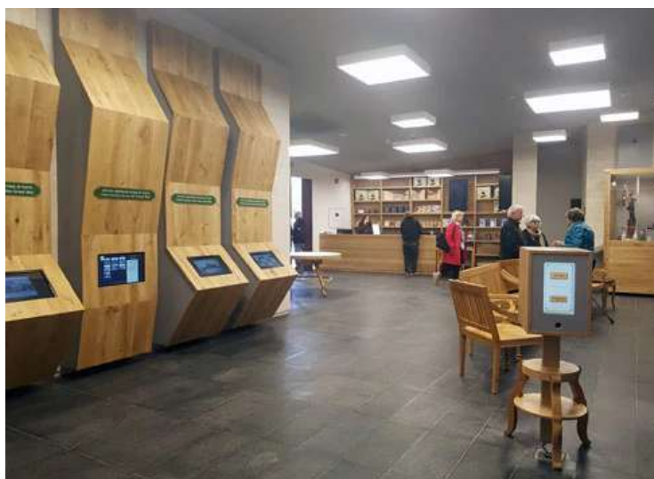
אולם התצוגה הרחב בתוך המרכז

מוטיב הצילום חוזר בתערוכה הקבועה, שאצר יעקב שקולניק ועיצבו דורון גומפרט ודליה פלק-זגורי; עמיר ברנר אחראי לעיצוב התאורה. בתוך אולם התצוגה הרחב שבנוי כבונקר, עם שלט "למרחב מוגן" שרק מעצים את תחושת הלוחמה - פוזרו מוצגים שונים, בהם שלושה פסלים של חיילים – בריטים, ניו זילנדי ואוסטרלי - ומודל חדש מעץ מלא של מצלמת חצובה ישנה. בעזרתה יכולים המבקרים להצטלם עם פסל חייל, ולשגר את התמונה באמצעות אפליקציה הישר אל הטלפון הנייד שלהם.