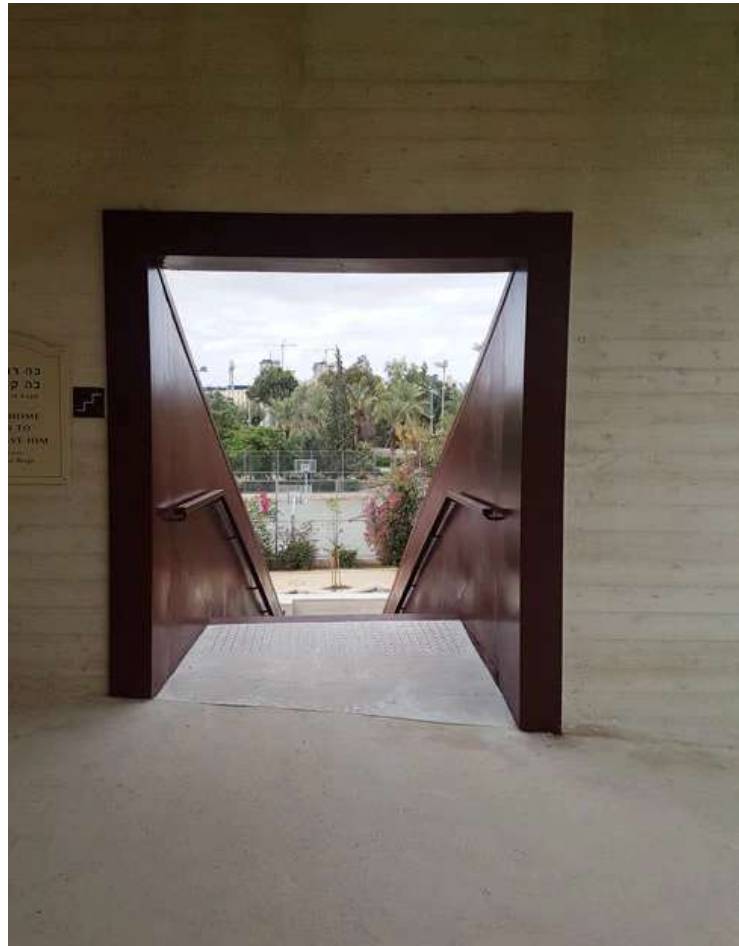
גרם המדרגות שמוביל מהמרפסת לקרקע עשוי פלדה בצבע בורדו

לצקת את הקירות בזווית קלה, בדומה לחומות מצודות ישנות (כמו מגדל דוד) או להבדיל מבנה המוסדות הלאומיים בירושלים (בתכנון יוחנן רטנר), שהשפיעו על קו המתאר של המבנה ועל גומחות החלונות והדלתות. אלה, וגם גרם המדרגות שמוביל מהמרפסת בחזרה לקרקע, עשויים פלדה בצבע בורדו.