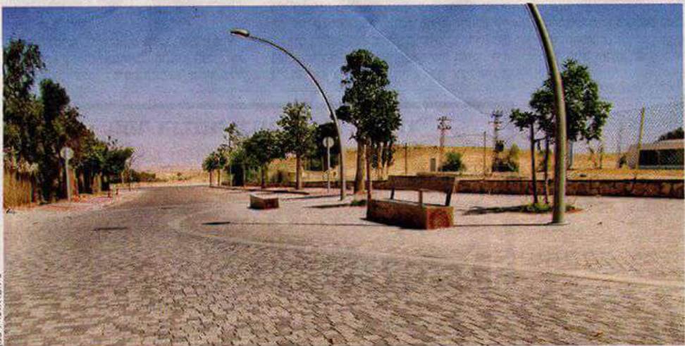
אזור התעשייה המתחדש במצפה רמון. חומרים במראה מקומי