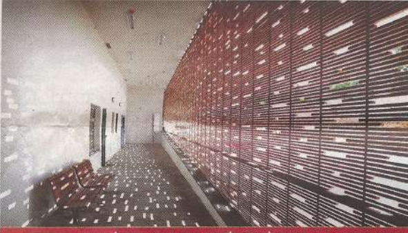
המרכז החדש בפנינת רמז-ארלוזורוב. למטה: בניין הוועד הפועל הסמוך