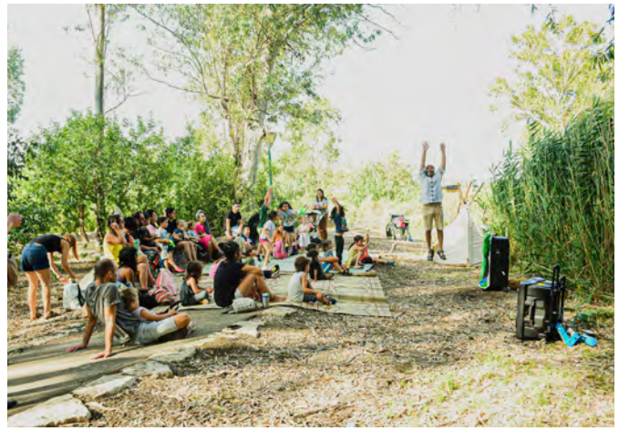
פסטיבל עיר הנחלים - ההצגה שבט לב אמיץ