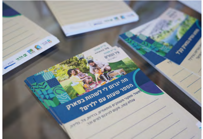
אירוע סיום שנה אקדמיה בכיכר - שותפות ציבור - קאפות של חלופות התכנון.

השכנים, שזכו גם הם לחשיפה. בנוסף, נפרסו עמדות הסברה ושיתוף ציבור, מטעם מחלקת תכנון של עיריית קריית שמונה, על פרויקט 'עיר הנחלים'. חלופות התכנון הוצגו לבאי האירוע וכמו כן חולקו גם שאלות לקהל הרחב על מנת לדייק את צרכי התושבים לגבי התכנון העתידי בפארק.