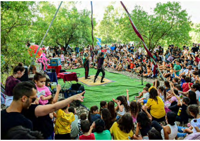
פסטיבל עיר הנחלים - האירוע המרכזי הקרקס הירוק