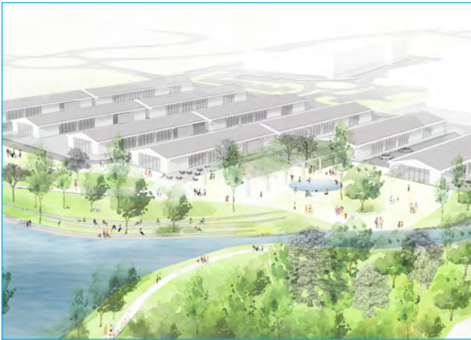
השער הדרומי-חלופות תכנון-מבט מצפון.