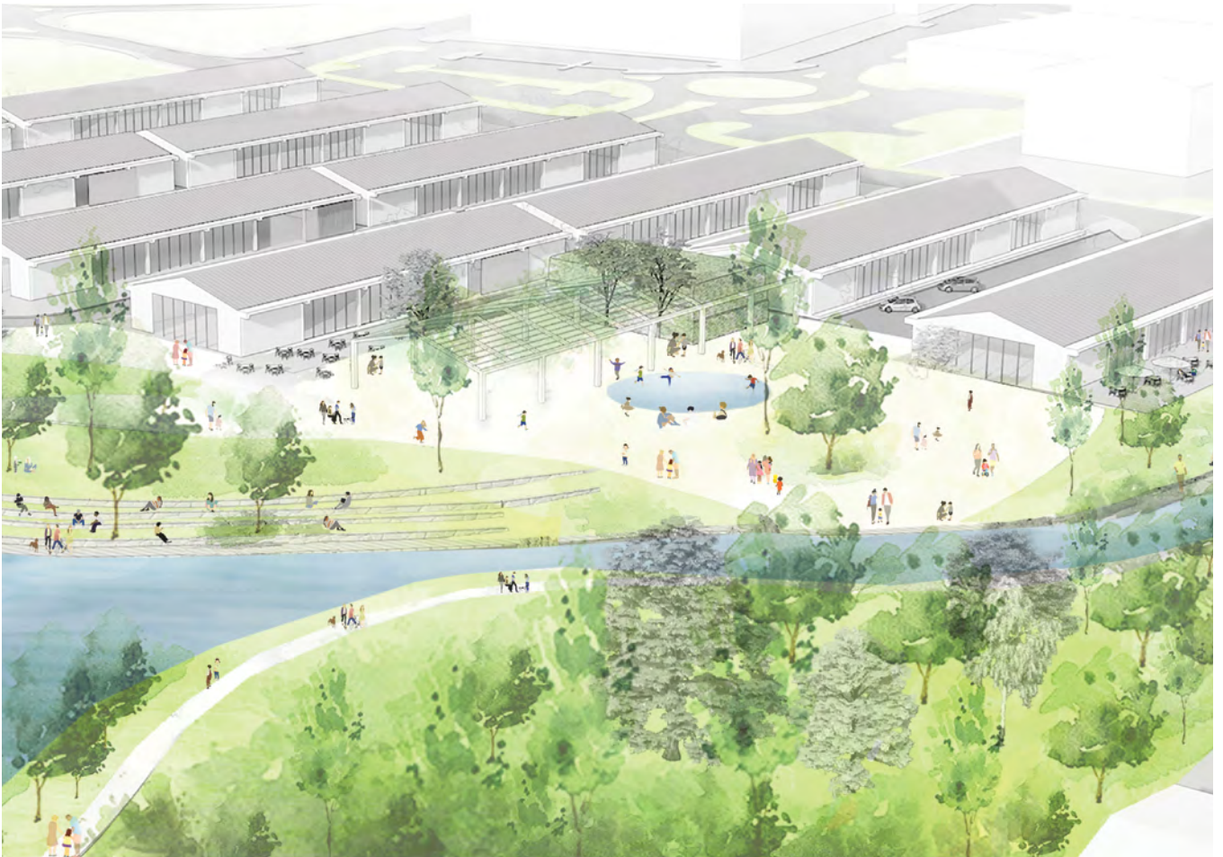
הדמיה: מייזליץ-כסיף-רויטמן אדריכלים